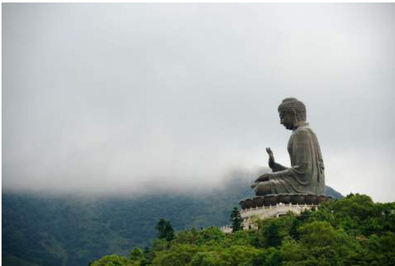
Buddha Amoghasiddhi, Lantau Island, Hong Kong