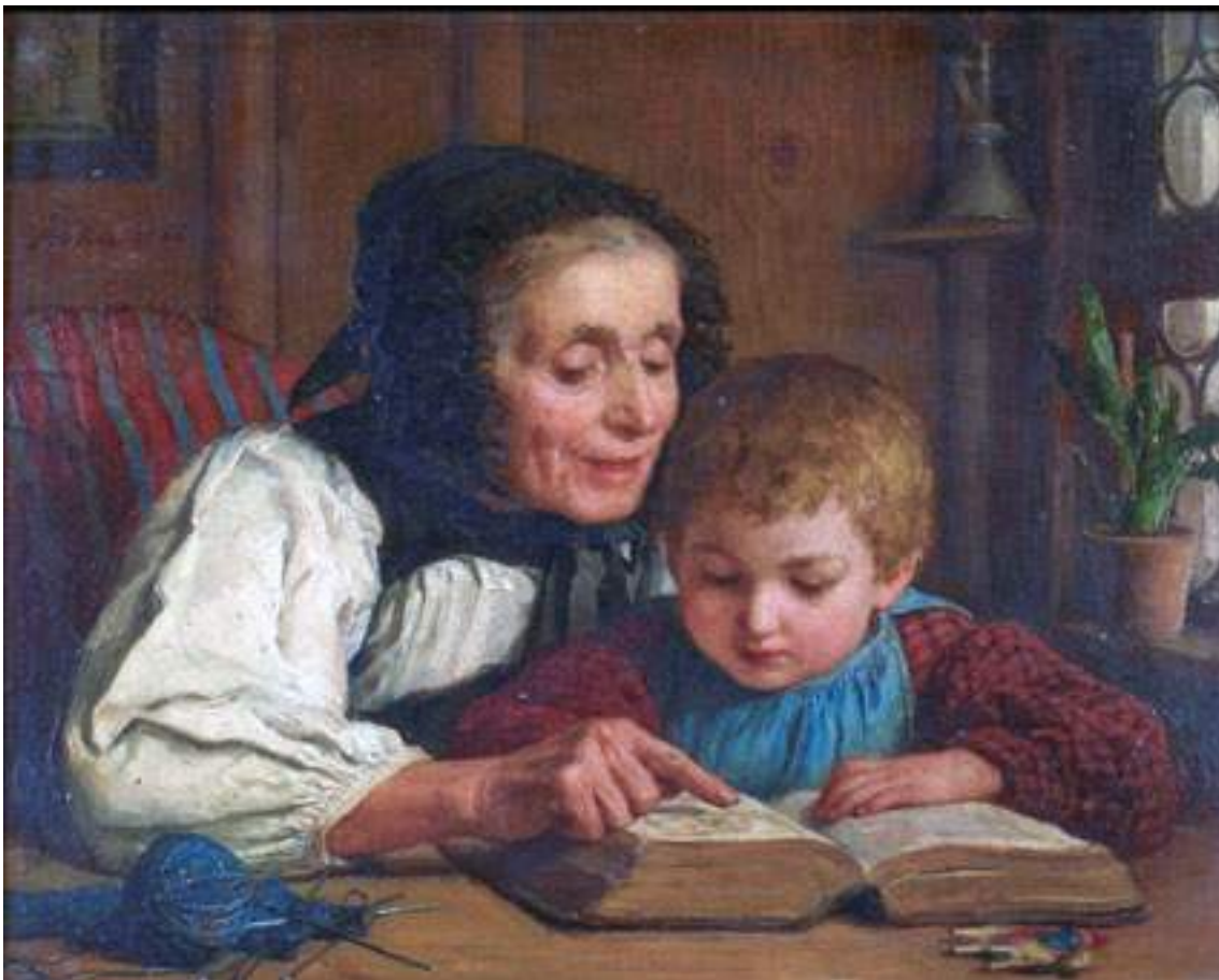
Das Bilderbuch , Albert Anker